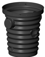
20" X 24" PUIT ONDULÉ POUR POMPE DE PUISARD