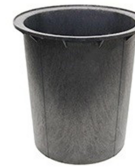
18" X 22" PUIT ÉTANCHE AU RADON