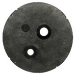
18" X 22" / 30" COUVERCLE ÉTANCHE AU RADON