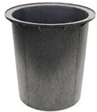
18" X 30" PUIT ÉTANCHE AU RADON